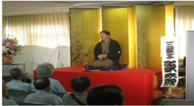
健康相談や落語家による口演会等を行いました。

看護週間のお知らせ 毎年5月12日は「看護の日」です。この「看護の日」を含む週を看護週間とし、全国各地で看護にちなんだ様々なイベントが開催されます。当院では毎年、近隣の皆様の健康相談や保育園訪問などを通して、地域の皆様と一緒に看護の心、ケアする心について考えるための企画を催しております。 今年には「 看護の心をみんなの心 」というテーマで、介護教室を実施します。 当院認定看護師が、介護に関する様々なポイントを実技指導によって紹介します。 その他にも、看護週間中、院内では「ずっと忘れられない看護」エピソードや、子供が描いた「お母さんの似顔絵」などの掲示を行っております。 詳しくは下記に記載されており、当院ホームページ、またはお電話にてお問い合わせください。