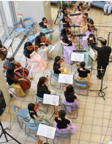
【昨年のコンサートの様子です♪】

広報誌「ろうさいの森」は今月号で創刊一周年を迎えます。今後も皆さんのお役に立てる情報を発信できるように一生懸命頑張ります。