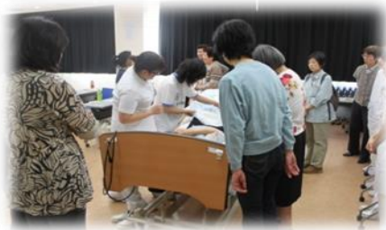
【オムツの装着を体験しました。】

低層棟3階大会議室にて介護教室を開催しました。口腔ケアやオムツの正しい装着方法、安楽な体位変換法が当院認定看護師によって紹介され、参加された方々にも実際に体験していただきました。