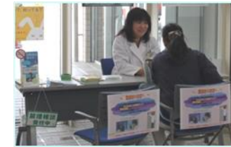
【無料禁煙相談の様子です】