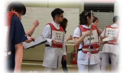
昨年度の訓練の様子