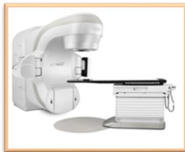
↑ 高精度放射線治療装置「True Beam」

呼吸同期システムを搭載し、肺の定位放射線治療にも対応しています。これらの機器の精度管理や、日々の出力校正などの管理業務を担っているのは我々診療放射線技師です。