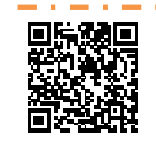
「ろうさいの森ブログ版」

新たに「東京労災病院ろうさいの森ブログ版」を開設しました。病院のホームページまたは、左記のQRコードよりアクセスできますので、ぜひご覧ください。