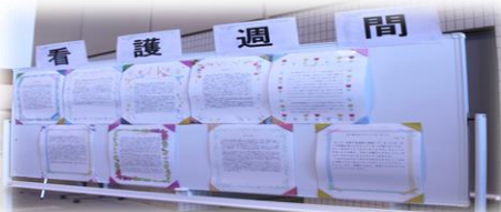
家族の絵・心に残った看護エピソード

当院では、5月12日（日）～5月18日（土）を看護週間とし、職員の家族が描いた「家族の絵」や「心に残った看護エピソード」を正面玄関にて掲示いたしました。