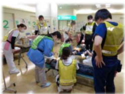
外来担当医表は裏面へ

地震や台風が頻繁に発生してい る今般、ご自身、ご家族の安全を 守るために、防災対策を今一度見 直してみたいかがでしょうか。