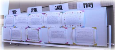
家族の絵・心に残った看護エピソード