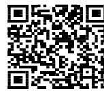
「ろうさいの森ブログ版」

新たに「東京労災病院ろうさいの森ブログ版」を開設しました。病院のホームページまたは、左記のQRコードよりアクセスできますので、ぜひご覧ください。