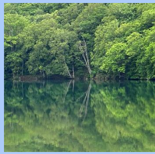
6月新緑の鳶沼（青森）