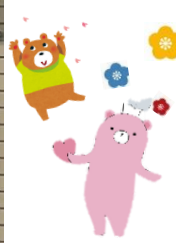
ナースのお仕事紹介（病棟編）▽

この期間は、看護の心・ケアの心・助け合いの心を広く知っていただくこと等を目的に、全国各地で様々な催しが行われております。