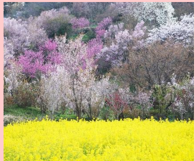
福島花見山