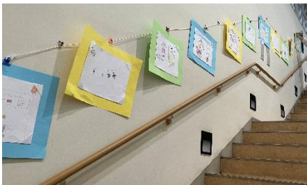
△看護師として働く家族の絵の掲示

当院でもお祝いの看護の日のポスター掲示や他部門からの看護師への応援メッセージの掲示等を行いました。