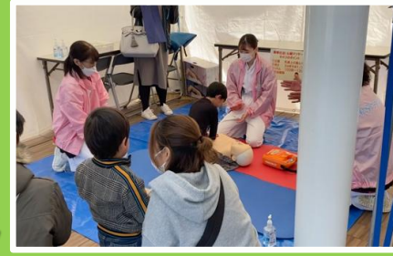
BigFun 病院長 森田 明夫 撮影